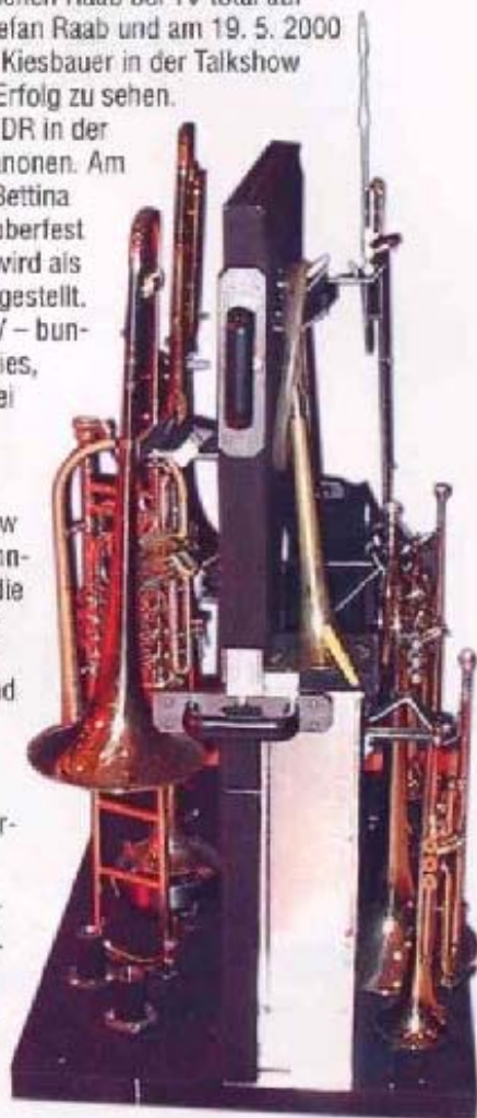
Durch diesen speziellen Instrumentenständer verkürzt sich die Aufbauzeit auf ca. 10 Sekunden. Dadurch ist auf der Bühne ein reibungsloser Ablauf garantiert, trotz der Fülle an Instrumenten.

Besuchen Sie einfach ihre nächste Show und lassen Sie sich überraschen.